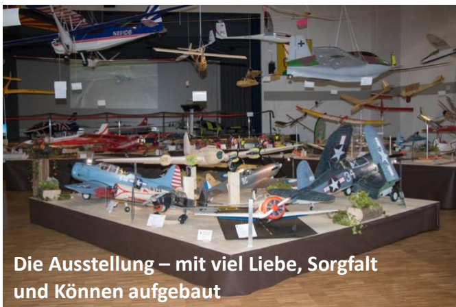
Die Ausstellung – mit viel Liebe, Sorgfalt und Können aufgebaut

Das Gesamterlebnis war bestens gelungen – der Kommentar der Gäste euphorisch!