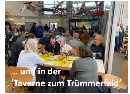
... und in der 'Taverne zum Trümmerfeld'