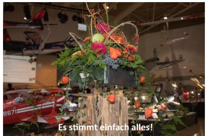
Es stimmt einfach alles!