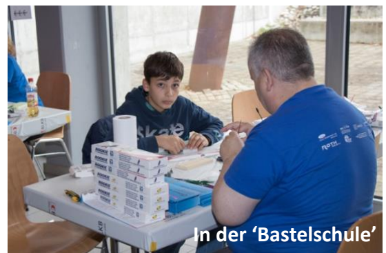
In der 'Bastelschule'

näher zu bringen, war denn auch ein Ziel der Ausstellung.