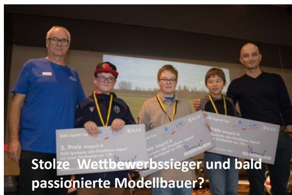
Stolze Wettbewerbssieger und bald passionierte Modellbauer?

Das Interesse dafür war erfreulich, und der Stolz über das Erreichte bei der Siegerehrung deutlich zu sehen.