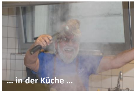
... in der Küche ...